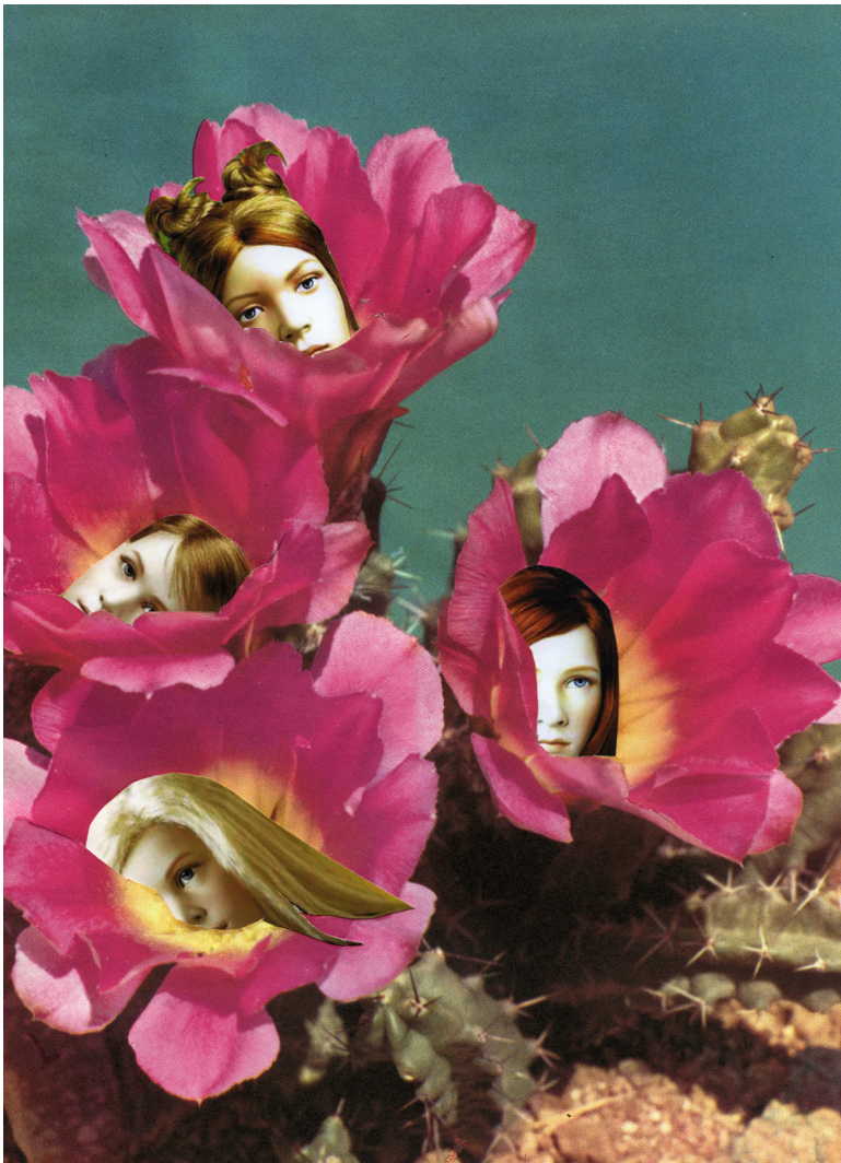
Marnie Weber, Cactus Girls (7.06.12) , 2012. Collection Frac Normandie © Marnie Weber

Plus d'informations : www.fracnormandie.fr