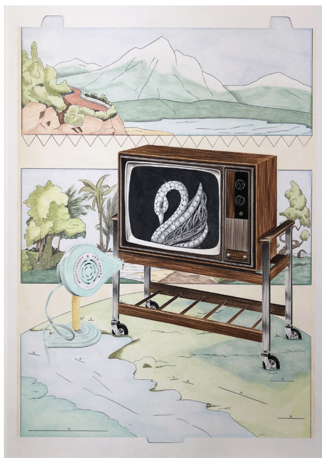
Audrey Aumegeas, Coup de cœur pour un cygne , 2022. © Audrey Aumegeas