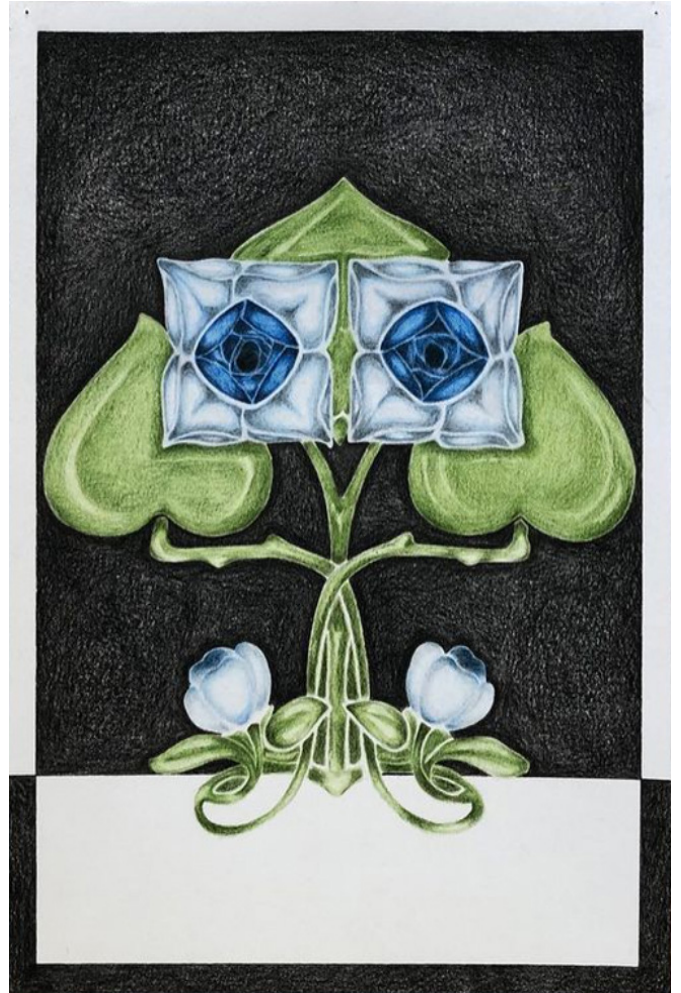
Audrey Aumegeas, Sans titre , 2022. © Audrey Aumegeas