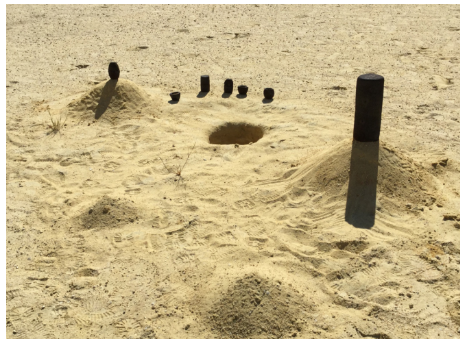
Lorène Plé, Ground Lava , 2020