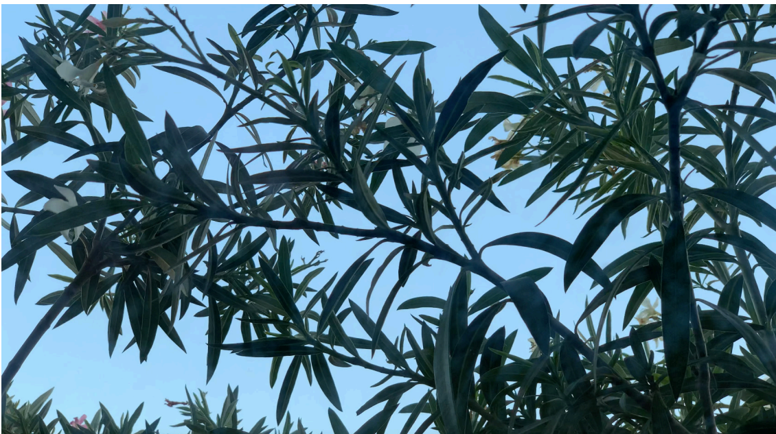
Georges Rey, Vent dans les lauriers roses , 2020. Collection Frac Normandie © Georges Rey

Plus d'informations : www.fracnormandie.fr