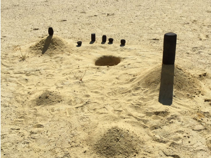
Lorène Plé, Ground Lava , 2020

À travers une expression plastique multitechnique mêlant dessin, sculpture, vidéo, son, écriture, maquette et photographie, Lorène Plé poursuit depuis plusieurs années une recherche qui l'implique activement dans les espaces qu'elle traverse. Sa pratique s'oriente vers la fabrication d'outils, qu'elle apprivoise comme des dispositifs d'écoute et de visualisation pour augmenter et explorer de nouvelles modalités de perception des corps en tant que systèmes environnementaux. S'exprime au sein de ce travail, l'enjeu commun de porter une attention particulière à la diversité des corps et des dynamiques qui forment et fondent l'espace que nous habitons.