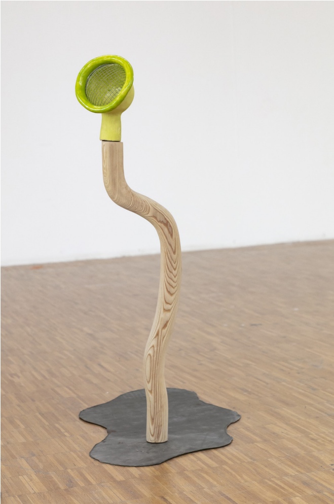
Gaëlle Barbiaux, Les douchettes , 2021.