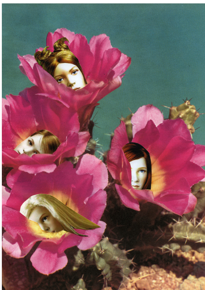
Marnie Weber, Cactus Girls (7.06.12) , 2012. Collection Frac Normandie © Marnie Weber