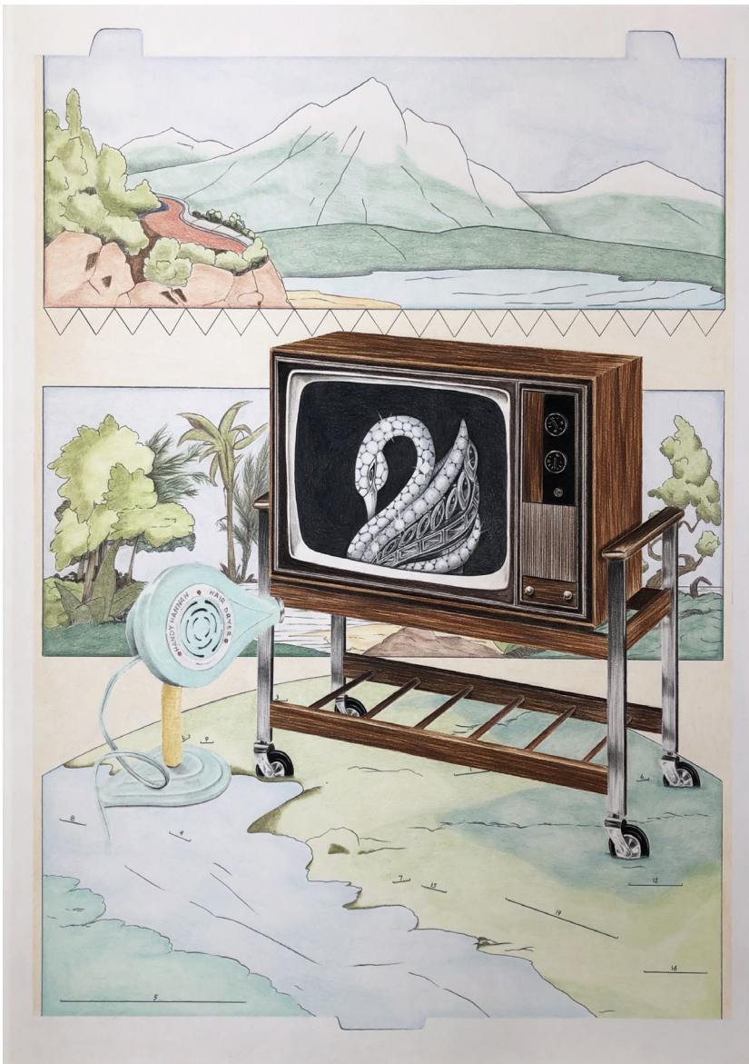
Audrey Aumegeas, Coup de cœur pour un cygne , 2022.

Plus d'informations : www.fracnormandie.fr