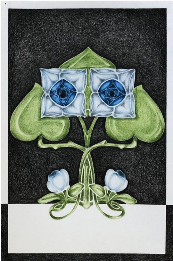
Audrey Aumegeas, Sans titre , 2022. © Audrey Aumegeas

Dans le cadre d'un dispositif « jumelage – résidence d'artiste en milieu scolaire » porté par le Frac Normandie, Audrey Aumegeas réalise une résidence au collège Saint-Louis à Cabourg du 27 mars au 07 avril 2023.