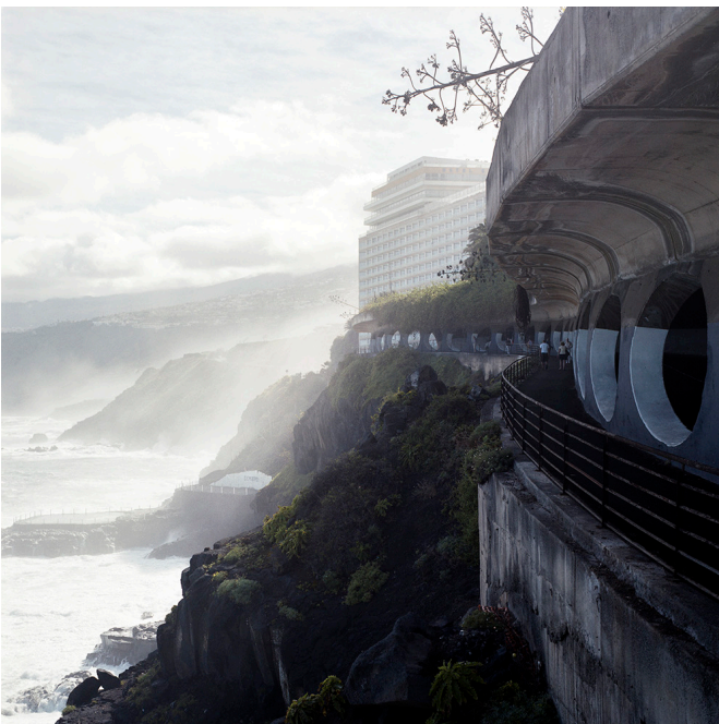
Édouard Decam, Santa Cruz , 2013. Collection Frac Normandie © Édouard Decam